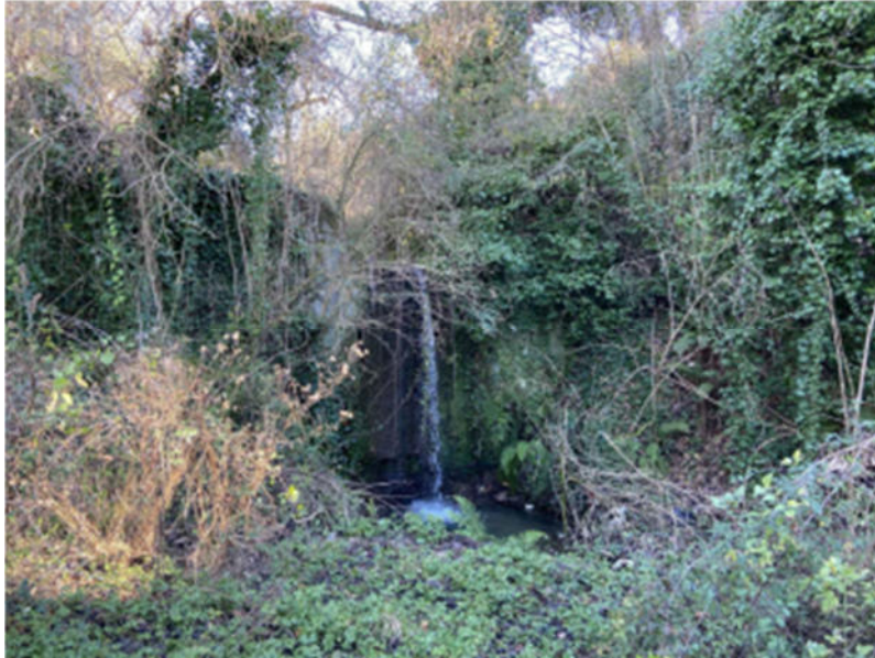
Foto 13. Roveto ed edera a ridosso di esemplare di Quercus e lungo gli argini