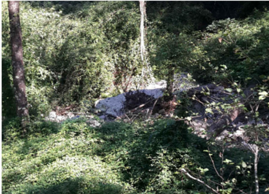
Foto 4. Roveti presso il greto con presenza di Ontano