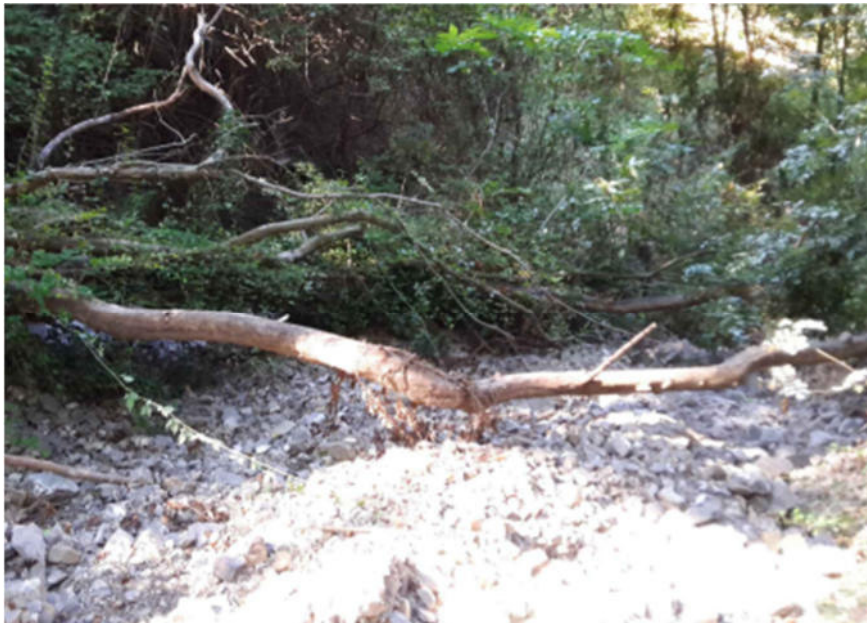
Foto 7. Rami secchi di pioppo