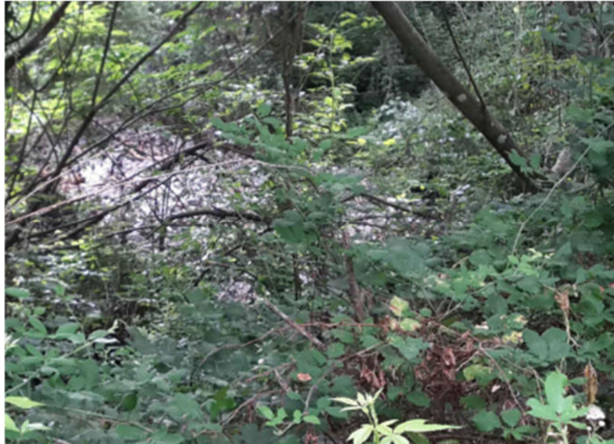
Foto 1. Roveto nella fascia al disotto dell'ontaneto