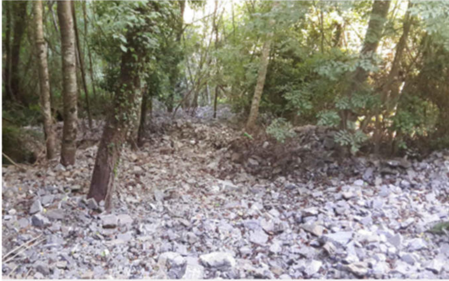
Foto 5. Bosco misto con Orniello e ontano