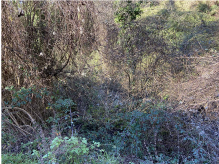
Foto 11. Roveto ed edera a ridosso deli argini