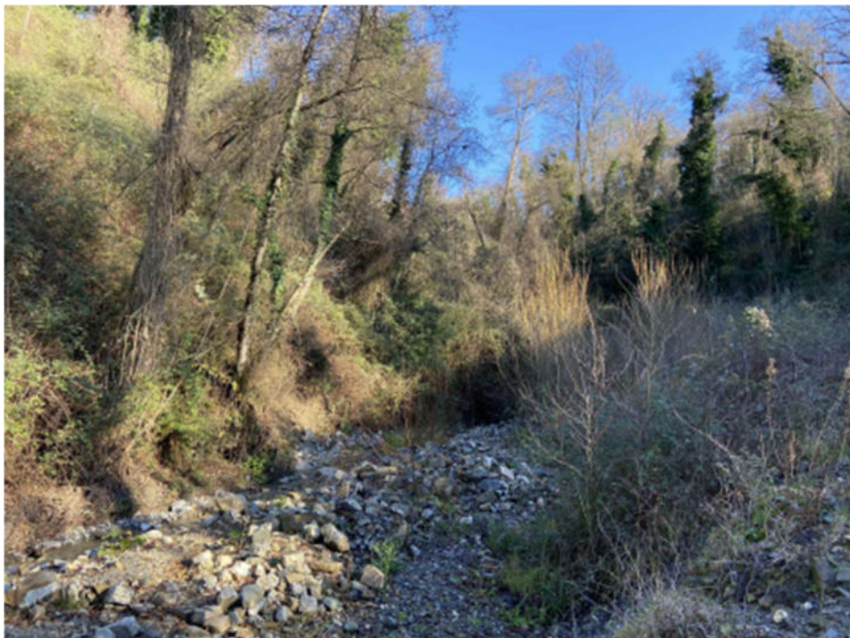
Foto 8. Pioppo ed esemplari di cerro ed ontano ai margini del torrente