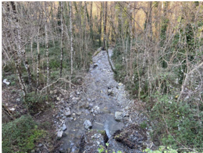
Foto 14. Esempari giovani di ontano e rovi nello strato inferiore