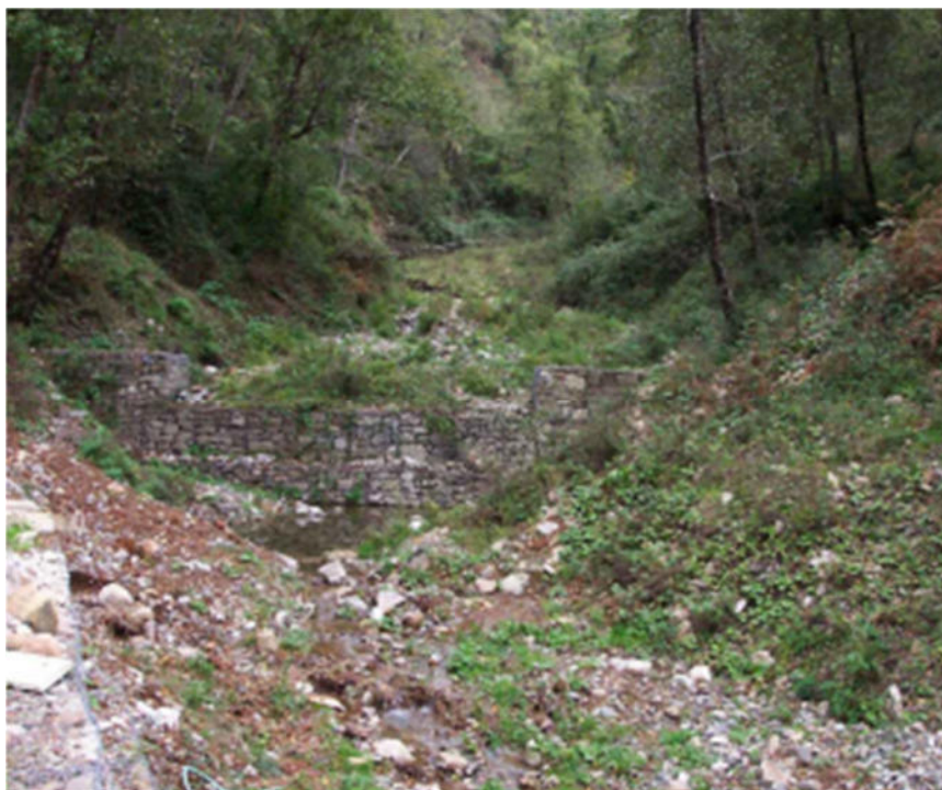
Foto 12. Esempari di Ontano con rovi