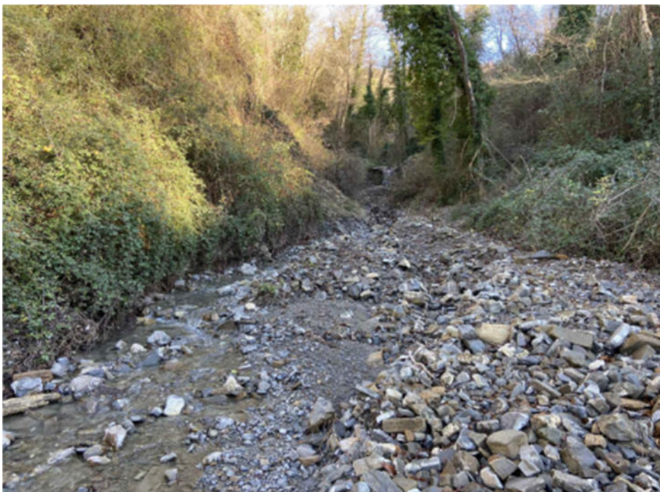
Foto 9. Roveto e ed esemplari di pioppo con edera