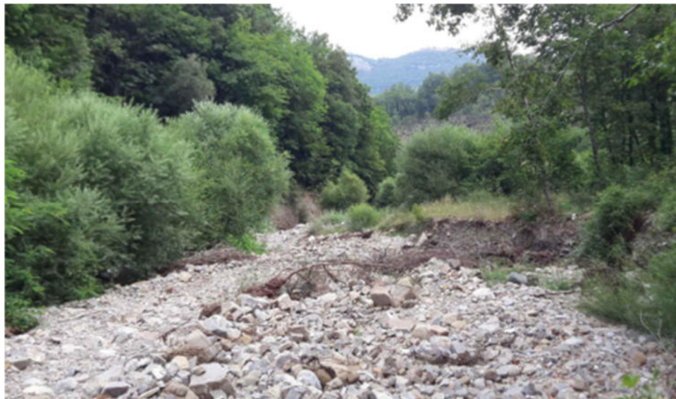
Foto 2. Saliceto in via di formazione