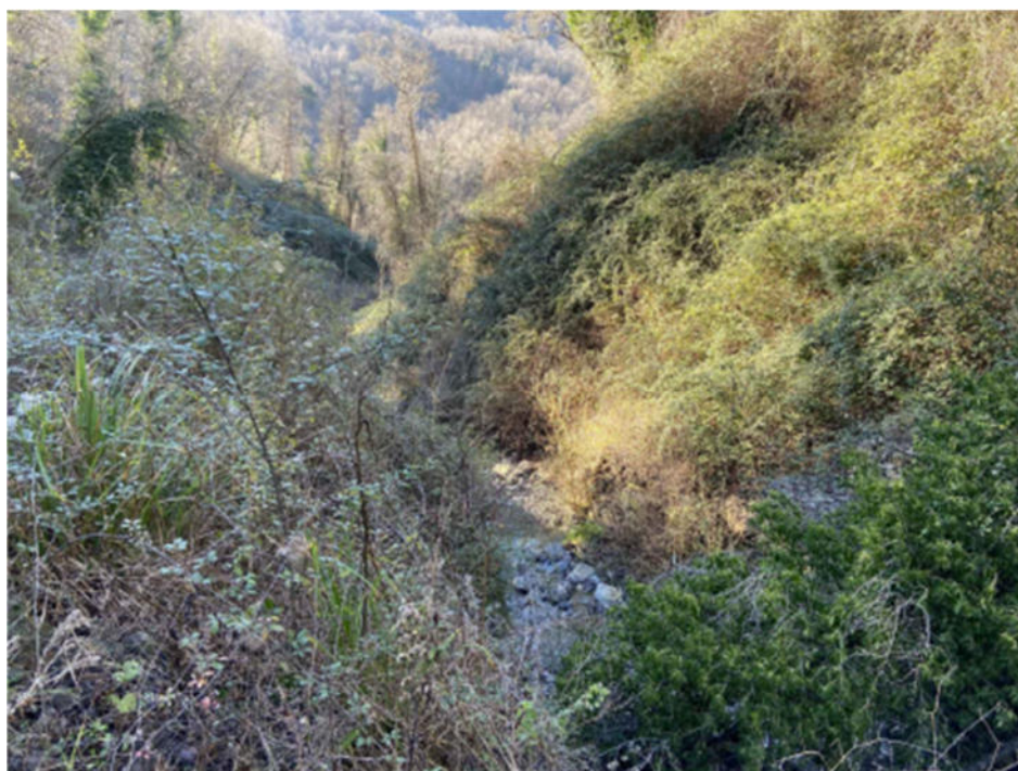
Foto 10. Roveto esteso soffocante la vegetazione erbacea